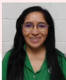
Marlén Yecenia Gutiérrez – Fiscal Nacional.